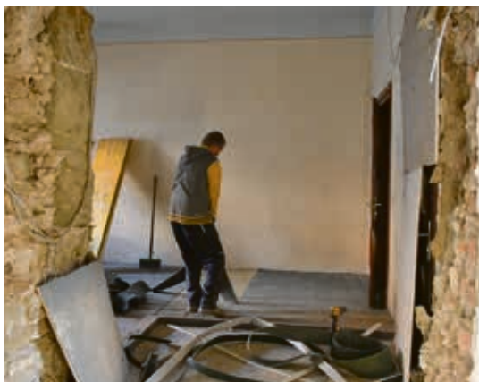
Die Wand zum Raum der ehemaligen Pressestelle in der 1. Etage wurde durchbrochen. Hier wird sich künftig eine WC-Anlage für Damen und Herren befinden.

Im Rahmen des bautechnischen Ausbaus werden schwerpunktmäßig funktionierende Rettungswege hergestellt, die Verwaltungs- und Gaststätteneinheit modernisiert sowie die Barrierefreiheit – soweit möglich – hergestellt.