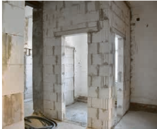
In einem Teilbereich über dem Ratskeller entsteht unter anderem auch ein Pausenraum für das Gaststätten-Personal.

Nach Billigung der erarbeiteten Vorplanung beauftragt die Stadt Sömmerda nach entsprechenden