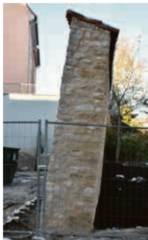
Aus dem Lot, aber stabil - der Stadtmauerabschnitt von der Einfahrt Innenhof gesehen.

Alles ist unter der Maßgabe des derzeit in der Aufstellung befindlichen und noch zu beschließenden Etats 2023 der Stadt Sömmerda zu sehen.