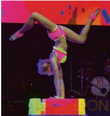
Impression vom Showprogramm im Jahr 2019.

Start für den Sportlerball ist 19:00 Uhr, Einlass ab 18:00 Uhr.