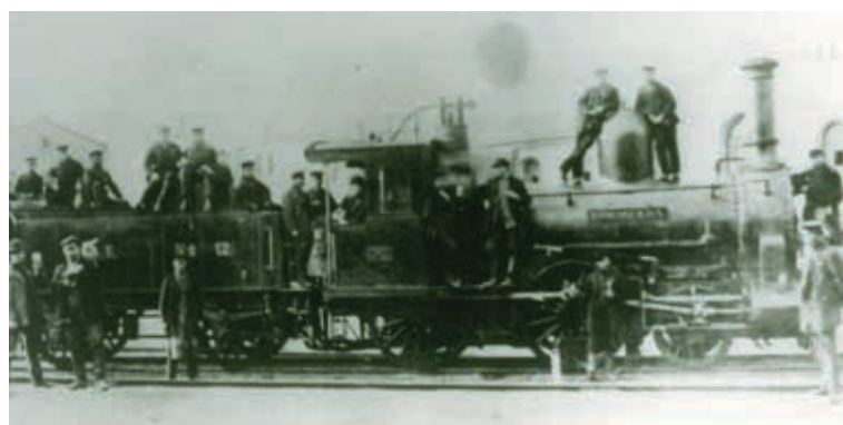
Die Lokomotive „Sömmerda“, gebaut 1873/74 in der Sächsischen Maschinenfabrik Chemnitz, in den 1880er-Jahren auf dem Werkstattgelände in Greußen.

Seit 150 Jahren ist Sömmerda an das Eisenbahnnetz angeschlossen: Am 14. August 1874 nahm die „Pfefferminzbahn“ zwischen Straußfurt und Großheringen ihren Betrieb auf.