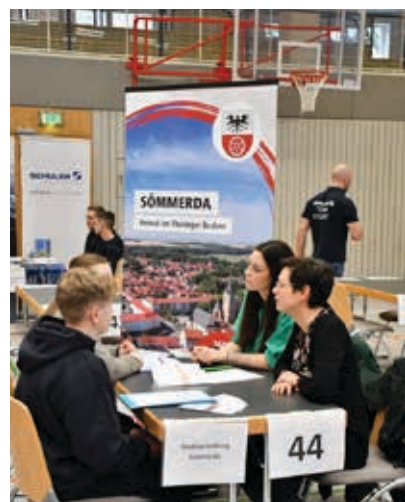
Schüler der 8. Klasse informierten sich über Ausbildungs- und Praktikumsmöglichkeiten bei der Stadtverwaltung