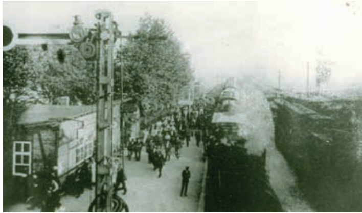
Ankunft eines Zuges aus Straußfurt in Sömmerda am unteren Bahnsteig, links die Wartehalle.

Strecke in der DDR mit hohem Fahrgast- und Transportaufkommen sowie die Jubiläumsfeierlichkeiten 1974 in Erinnerung. Ein Stand der Erfurter